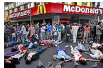
Anti-Kriegs-Protest (in Buenos Aires): Fesseln für den neuen Gulliver

Im Amerika der neunziger Jahre fanden Kriege kein Gefallen. Das Land lebte einen beispiellos lang anhaltenden Boom aus, befand sich im Rausch der New Economy und war daher mit sich selbst beschäftigt. Der Turbokapitalismus, der raschen Reichtum versprach, war wichtiger als der unipolare Moment in der Weltpolitik. In dieser kollektiven Gemütsverfassung erreichten selbst die ersten Anschläge Osama Bin Ladens nur flüchtige Priorität. Clinton handelte im Übereinklang mit der Nation, als er sich mit etlichen Cruise Missiles auf vermutete Qaida-Stützpunkte in Afghanistan begnügte.